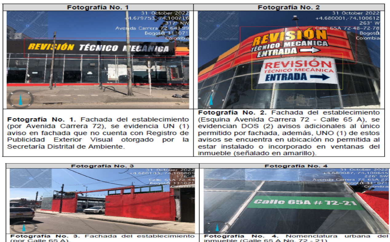
Tabla 3. Registro fotográfico

Valoración técnica y conductas generales evidenciadas (Ver Anexo No. 1. Acta de Visita No. 205348).