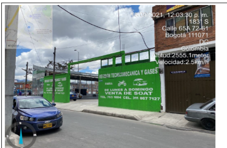
Fotografía No. 3. Publicidad establecimiento de comercio CDA AV Boyacá Por CI 65 A.