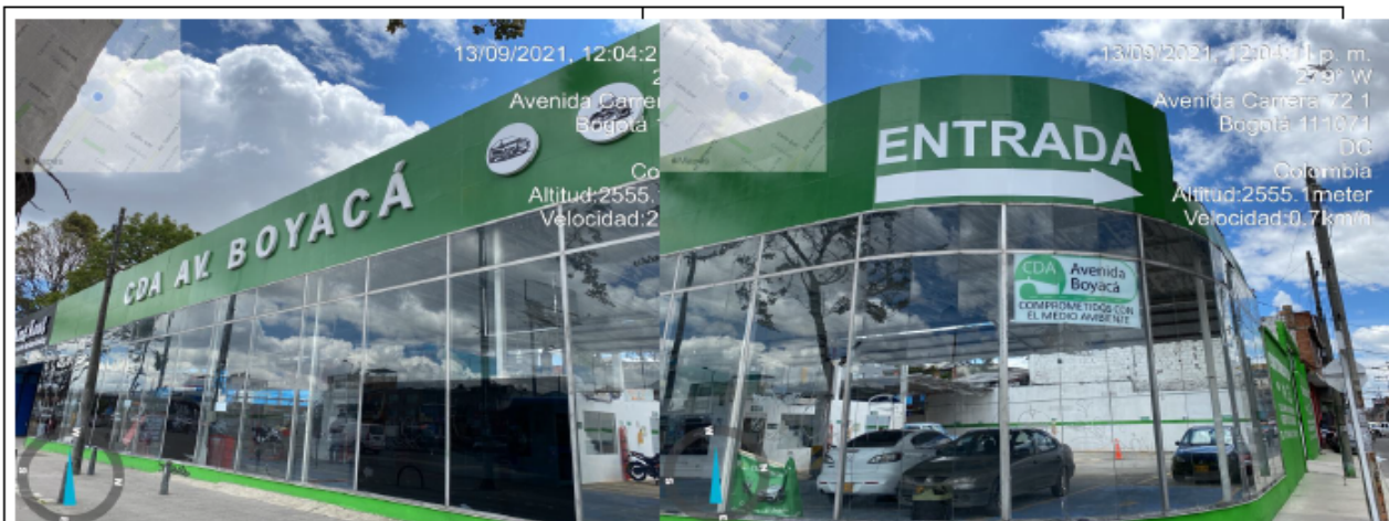
Fotografía No. 1. Publicidad establecimiento de comercio CDA Av Boyacá instalado por la avenida Boyacá